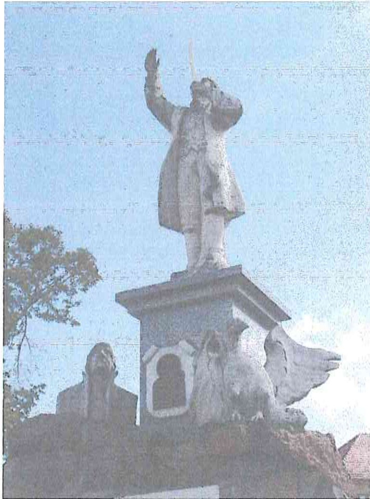
Fot. 4. Pomnik Tadeusza Kościuszki.