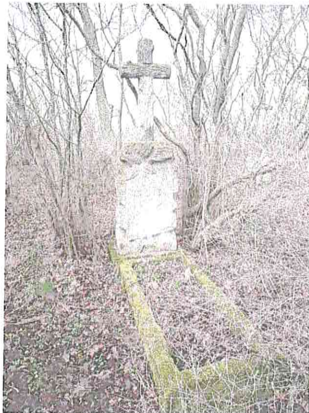
Fot. 7. Cmentarz ewangelicki w Siarczycach.