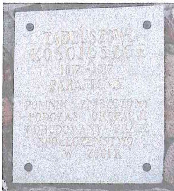
Fot. 5. Pomnik Tadeusza Kościuszki – tablica na cokole (fot. Ewa Kirsz).