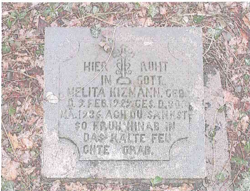
Fot. 3. Płyta nagrobna na cmentarzu ewangelickim w Sarnowie.

Na terenie gminy znajdują się także cmentarze ewangelickie, położone w miejscowościach: Siarczyce, Sarnowo, Lubraniec, etc.