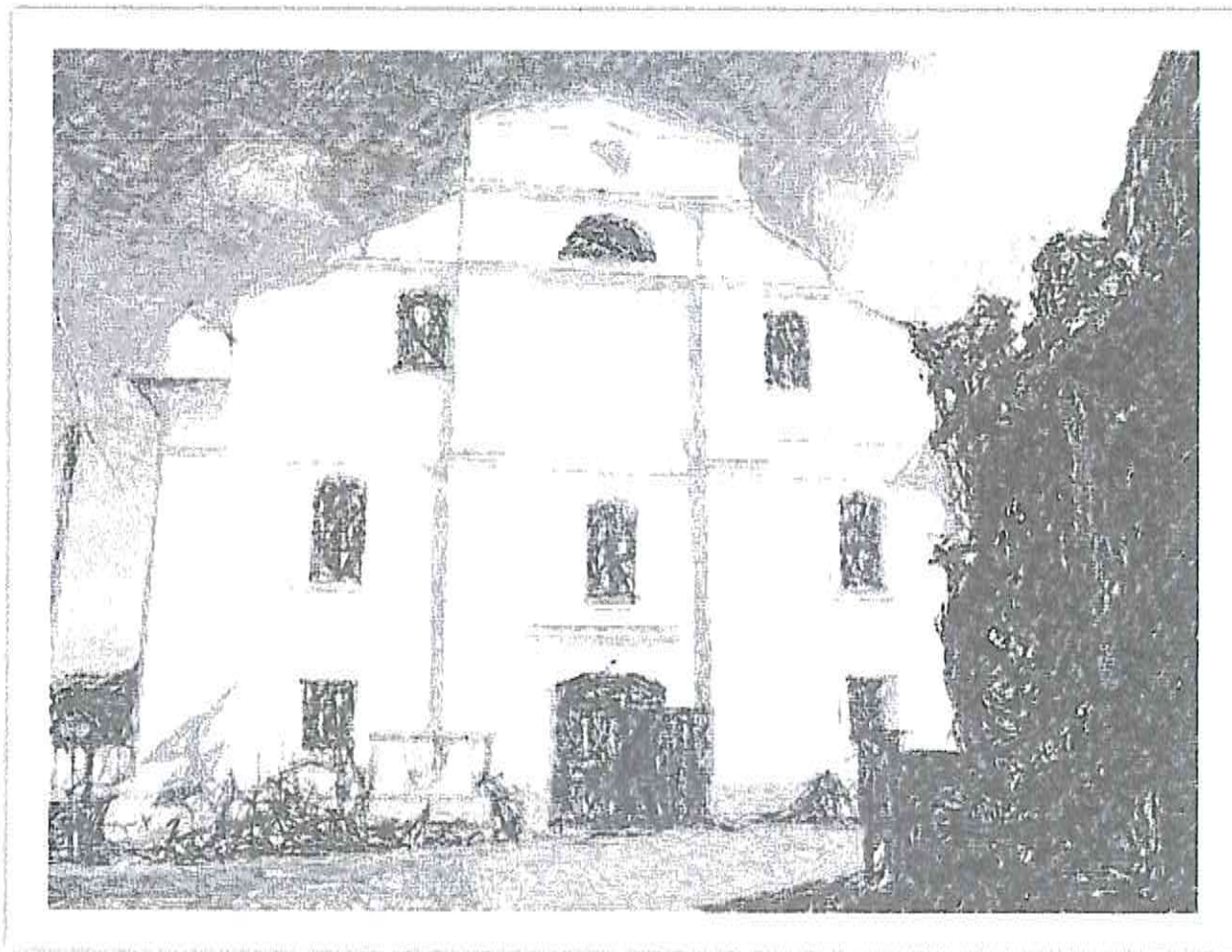
Fot. 1. Stylizowane zdjęcie dawnej synagogi w Lubrańcu