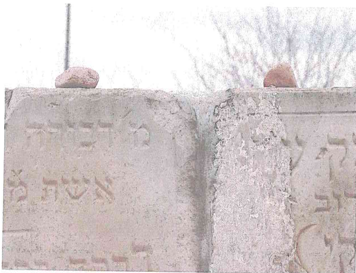
Fot. 9. Fragment lapidarium powstałego z odzyskanych macew na terenie dawnego cmentarza żydowskiego.