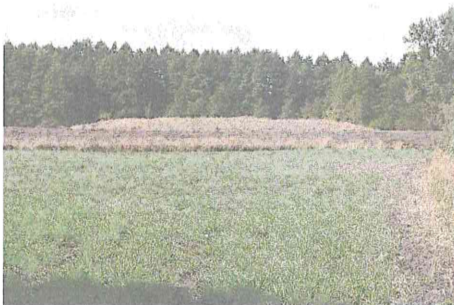
Fot. 2. Grodzisko średniowieczne w Zgłowiączce

Z najważniejszych obiektów archeologicznych wymienić można grobowce megalityczne w Sarnowie oraz trzy grodziska średniowieczne, w miejscowościach Sułkowo, Turowo i Zgłowiączka. Formą ochrony tych stanowisk są wpisy do rejestru zabytków województwa kujawsko-pomorskiego i gminnej ewidencji zabytków. Stanowiska archeologiczne wpisane do Rejestru zachowane są w stanie dobrym, bez wyraźnych zagrożeń, także inwestycyjnych. Ponadto w Zgłowiączce grodzisko wchodzi w skład średniowiecznego zespołu osadniczego.