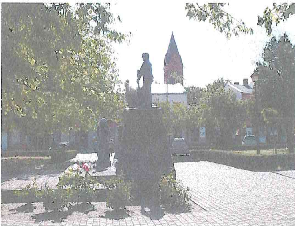
Fot. 8. Pomnik Poległych za Wolną i Niepodległą Polskę, na rynku w Lubrańcu.